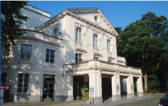
Théâtre Royal du Parc