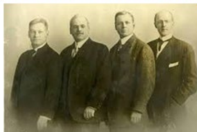
Paul Harris 1868-1947

« Whatever Rotary may mean to us, to the world it will be known by the results it achieves »