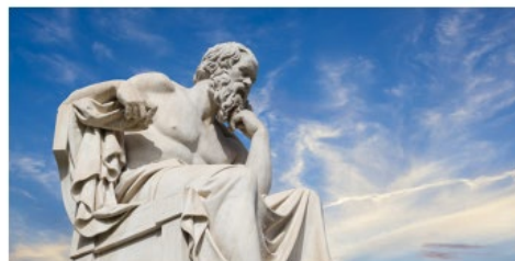
Socrate (né en -470/469, mort en -339)